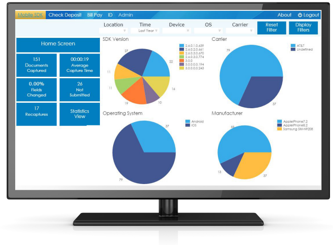
Estos paneles de control interactivos y visuales proporcionan datos y opciones pormenorizadas que rastrean y analizan la eficacia de Mobile Deposit Capture y otras soluciones de la gama Kofax Mobile Capture Platform™.